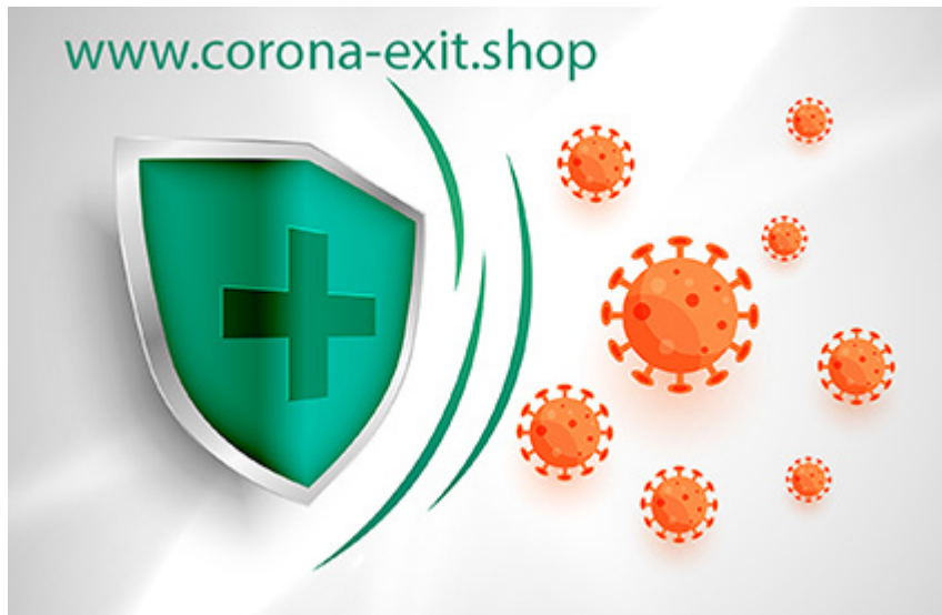
Abb. 1, 2 und 3: Sicheres Einkaufen von individuell konfigurierbaren Infektionsschutz-Systemen und Hygieneartikeln ist für Unternehmen ab sofort online unter www.corona-exit.shop möglich.