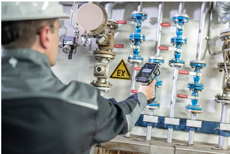
Abb. 2: Mobiles Datenmanagement im Ex-Bereich.