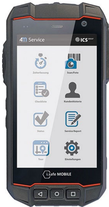
Abb. 3: Ex-geschütztes Industrie-Smartphone von i.Safe MOBILE mit ICS-Software.