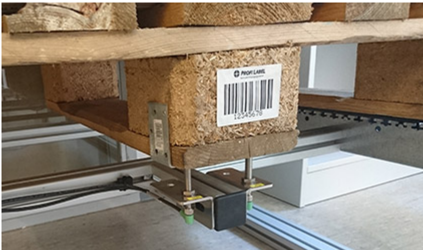
Abb. 3: Die ICS Group gewährleistet mit dem Betreibermodell „CARE Labeling & Marking“ hochverfügbare Kennzeichnungsprozesse, so unter anderem zur automatisierten Palettenfußkennzeichnung in der Intralogistik. Das eigens dafür entwickelte Spezialetikett der soloSYNTH® S Serie hält dauerhaft auf jeder verunreinigten Oberfläche.

Abb. 2: Effiziente Ladungsträgerkennzeichnung im Betreibermodell: Mit dem Industrie 4.0 Etikettierer eMATRIX® S7000 werden GS1-Transportetiketten in einem einzigen Arbeitsschritt gedruckt und aufgebracht. Unternehmen können die Lösung bei der ICS Group als Betreibermodell ohne Anlageninvestition erwerben. Sie erhalten dadurch einen hochverfügbaren Kennzeichnungsprozess und steigern ihren EBIT.