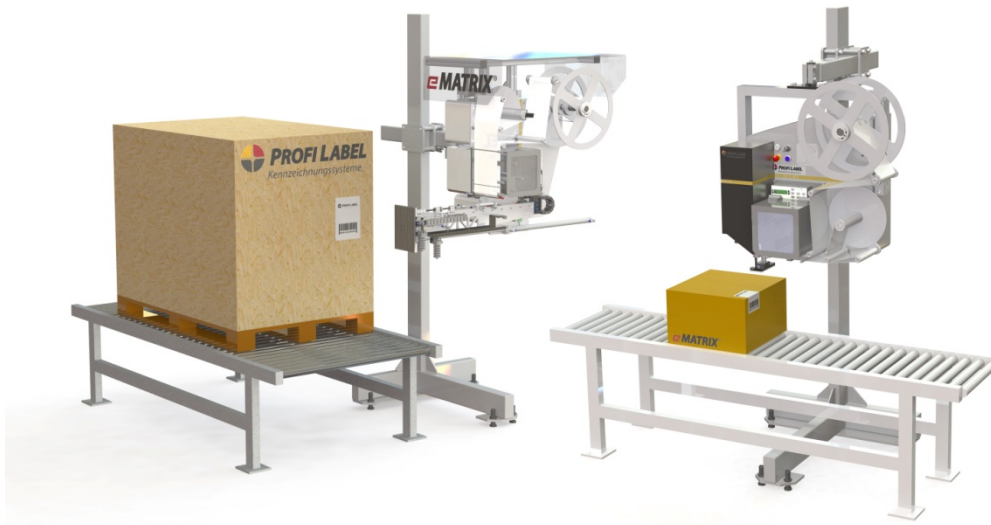
Abb. 2: Effiziente Ladungsträgerkennzeichnung im Betreibermodell: Mit dem Industrie 4.0 Etikettierer eMATRIX® S7000 werden GS1-Transportetiketten in einem einzigen Arbeitsschritt gedruckt und aufgebracht. Unternehmen können die Lösung bei der ICS Group als Betreibermodell ohne Anlageninvestition erwerben. Sie erhalten dadurch einen hochverfügbaren Kennzeichnungsprozess und steigern ihren EBIT.