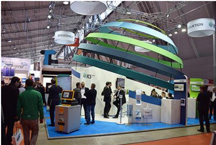
Abb. 1: Logistik 4.0 zum Anfassen – Die ICS Group stellt auf der LogiMAT 2016 pragmatische Internet of Things (IoT) Lösungen für die Supply Chain vor.

Das nachstehende Bildmaterial in Druckauflösung erhalten Sie auf dem beigefügten Datenträger.