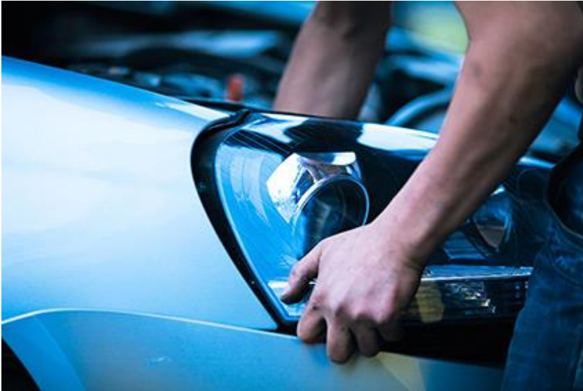
Abb. 3: Prozessoptimierung in der Automobilindustrie: In der Montage oder in der Assemblierung bei Fahrzeugherstellern und Zulieferern: Kommissionierung führt in Kombination mit Wearables sowie BVI zu sicheren und verbesserten Prozessen.