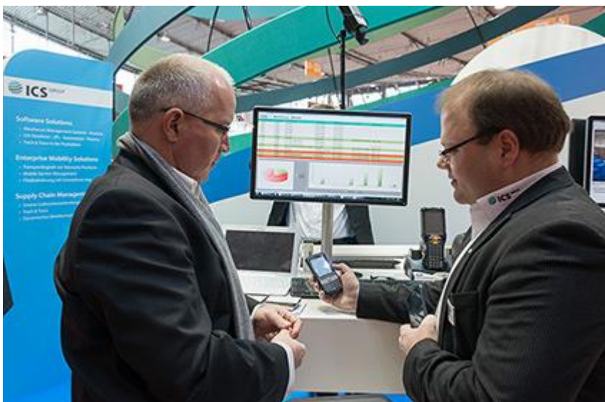
Abb. 2: Zur Optimierung und Dokumentation des Verpackungs- und Versandprozesses stellt ICS neue integrierte Lösungen im Warehouse-Management System Stradivari® vor.