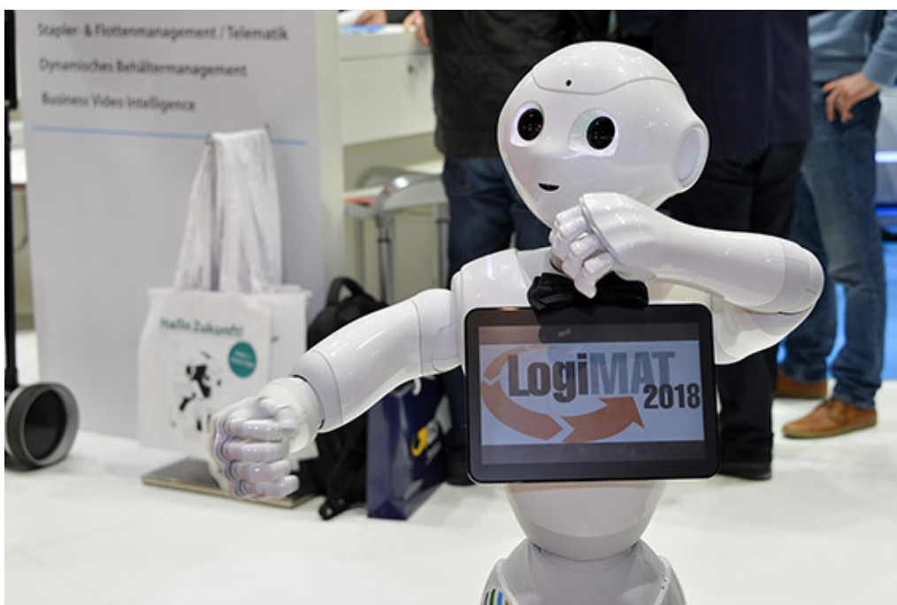
Abb. 5: LogiMAT 2018, Halle 8 / Stand A21: Die ICS Group und der humanoide Roboter Pepper freuen sich auf persönliche Gespräche zur Digitalen Transformation in der Supply Chain.