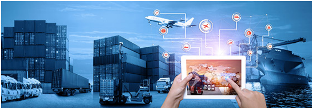
Abb. 1: Unter dem Messestandmotto „Acting Supply Chain“ präsentiert die ICS Group auf der LogiMAT 2018 innovative und integrative Digitalisierungslösungen, die den Mittelstand sowie Konzerne zur agilen, sicheren und selbststeuernden Prozessgestaltung in der unternehmensübergreifenden Supply Chain befähigen.