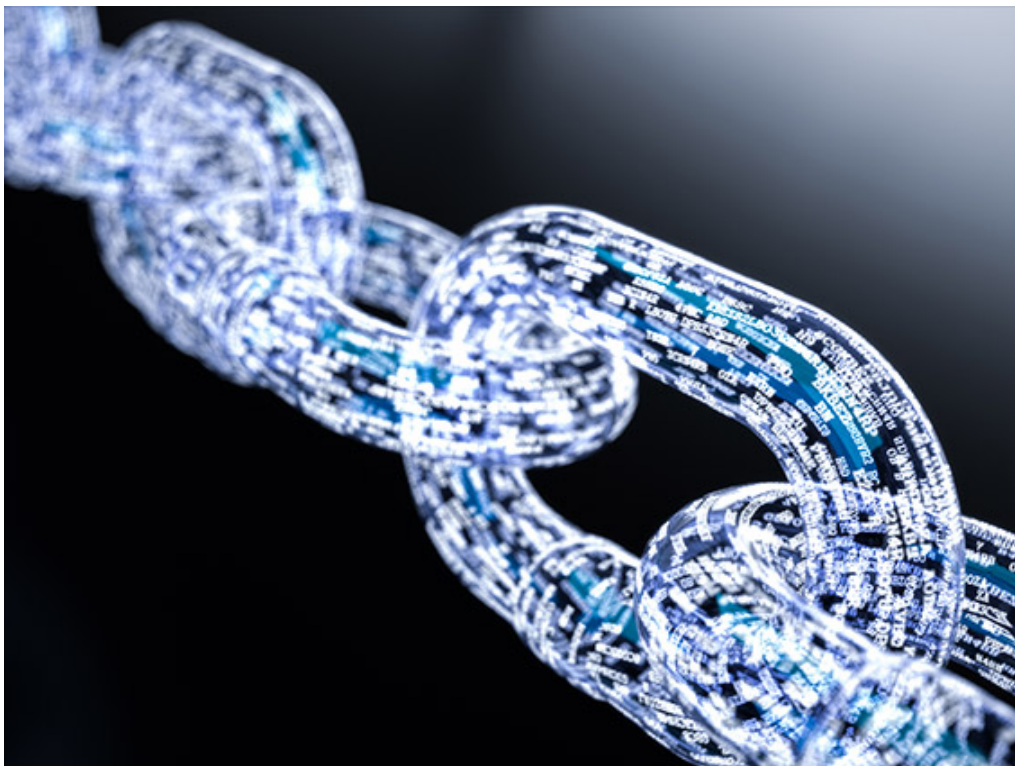
Abb. 2: Zur LogiMAT 2018 wird die ICS Group den erheblichen Mehrwert von Blockchain in der Supply Chain anhand von Praxisanwendungen aufzeigen, unter anderem für globale Warenbewegungen.