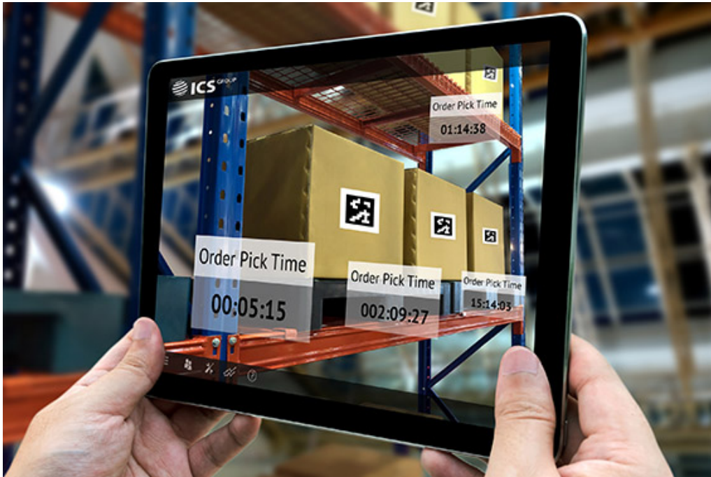
Abb. 3: Virtuelles und Reales gehen bei der Digitalen Transformation ineinander über. Als projekterfahrender Partner realisiert ICS individuell passgenaue Lösungen für die agile Supply Chain in Echtzeit und bietet alle Leistungen aus einer Hand.