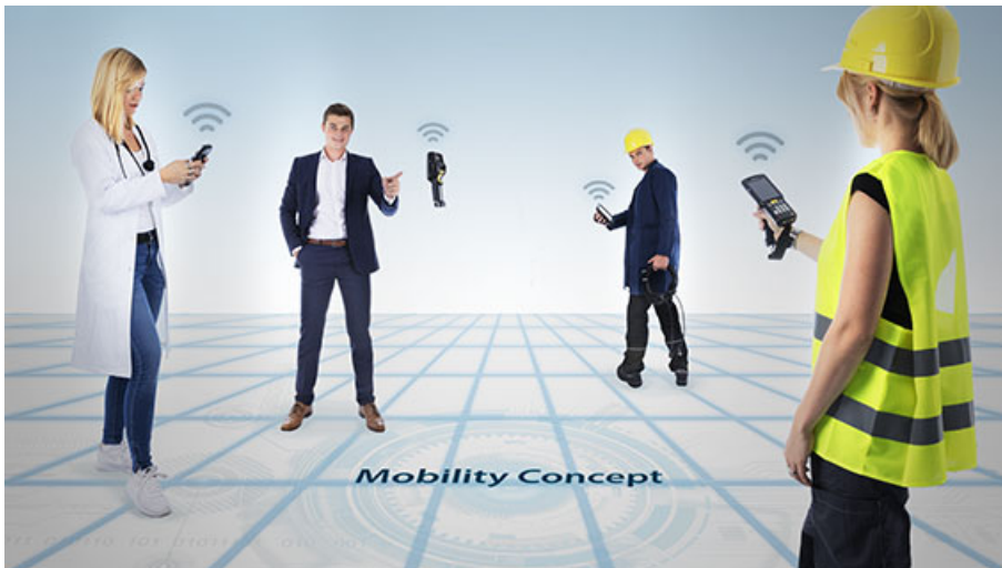
Abb. 4: Die ICS Group informiert auf der LogiMAT 2019 zu individuell passgenauen Migrations- und Integrationskonzepten für die mobile IT-Infrastruktur in der Supply Chain.