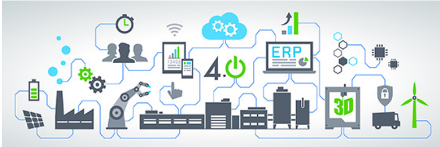
Abb. 3: Die ICS Group zeigt auf der LogiMAT 2019 integrative Lösungen für die digitale Supply Chain im Mittelstand und in Konzernen – End-to-End.