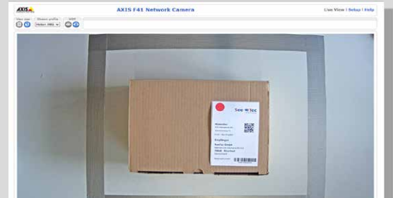
Beispiel: Farberkennung auf Versandetikett